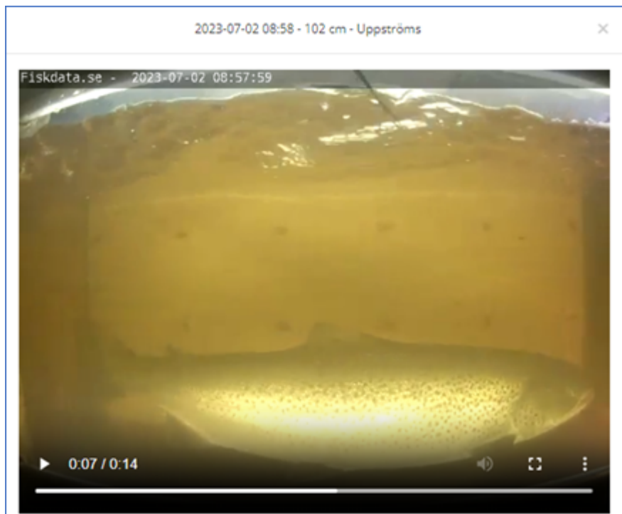
2/7 passerade denna öring